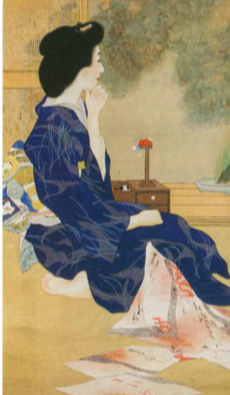
吉池 青園「作品名未詳(もの思い)」大正時代