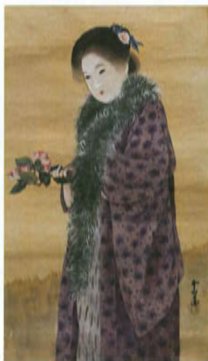
井上 金三郎「美人画」(部分)大正時代