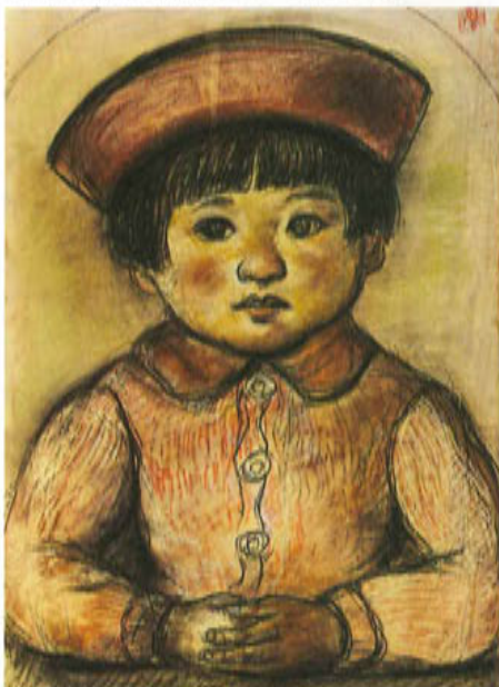
榑 貞雄「彩子像(赤い帽子)」1955年頃