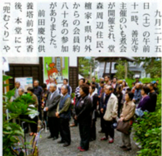
兜むくり いも煮会開催

「殿様との接見の場再現」の寸劇等が行われました。 その後、いも煮やこんにゃくが振る舞われ、和やかな雰囲気の中で親睦交流がなされました。 腹ごしらえをしてから、希望者を募って慶次清水・無苦庵跡・月見平等を案内しましたが、初めて散策された方には大変喜ばれました。