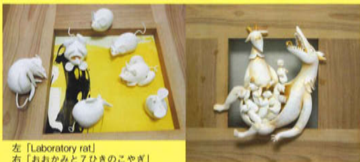
左「Laboratory rat」 右「おおかみと7ひきのこやぎ」

動物が登場する童話や物語を平面と立体作品の共生により 絵本化する（case study）（すぎやまあるく）