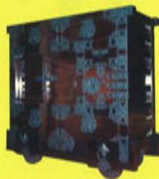
米沢筆筒 永井家具店（大正元年創業）

織物の産地米沢ならではの 上下に分かれる「衣装筆筒」 のほか、「階段筆筒」や「米沢 唐戸」と呼ばれる車輪付きの 筆筒もある。櫛を材料に桜や 蝶などの丸くて大きな金具も 特徴。