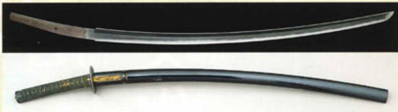
【重要美術品】太刀 銘 長船長光/文永十一年十月廿五日 黒漆打刀拵 [米沢市上杉博物館]