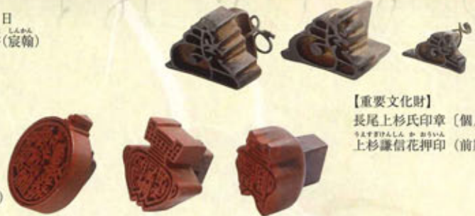
【重要文化財】 長尾上杉氏印章 [個人] 上杉謙信花押印 (前期)