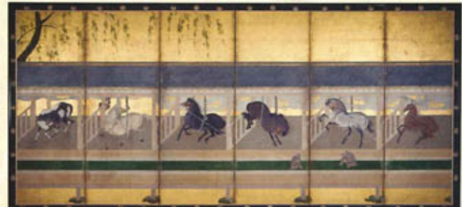
【山形県指定文化財】鞍圖屏風 左隻 (後期) [米沢市上杉博物館]