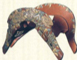
▲鷹山の善政を称え將軍からの褒美 金型子地牡丹文高野絵鞍(当館蔵)〔後期〕