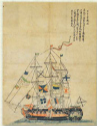
▲迫る脅威と軍備の再編 アリンヤ掛船図（致道博物館蔵）〔後期〕

今年は鷹山の生誕二百七十年であり、二百回忌にあたります。本展覧会では、米沢藩上杉家の存続をかけて苦闘した、鷹山の人間像と家臣団の働きぶりに注目します。