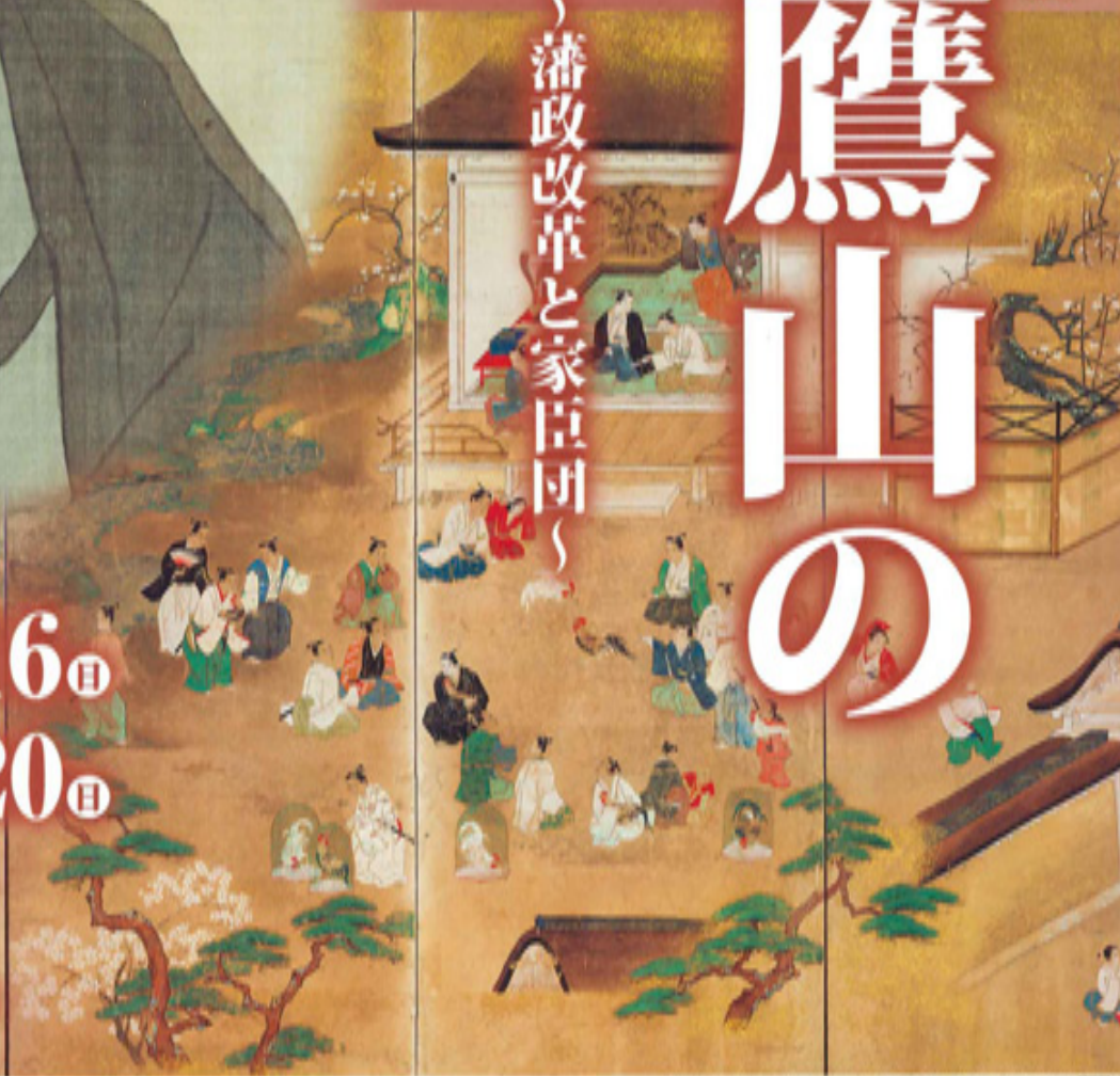
▲左近司徳春筆「四季家臣団屏風」(右隻)(重要文化財複製保存会蔵)〔近所〕