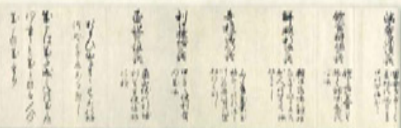
▲家臣に贈る「なせばなる」の和歌 国史 上杉家文書 上杉鷹山書状(部分)(当館蔵)〔後期〕