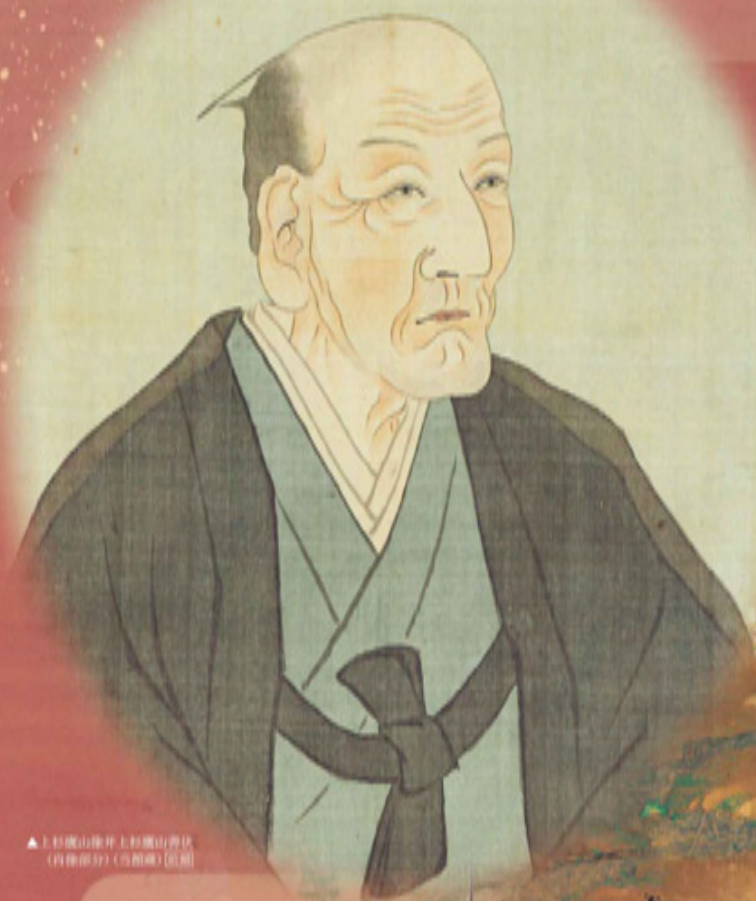
▲上杉鷹山像并上杉鷹山香炉(自傳部分)(当館蔵)〔近所〕

2021年 前期 4/17(土) ▶ 5/16(日) 後期 5/22(土) ▶ 6/20(日)