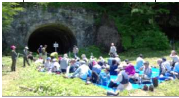
昭和のトンネルと明治のトンネルが二つ並んでいます