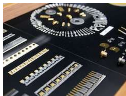
精密コネクタ部品への表面処理紹介