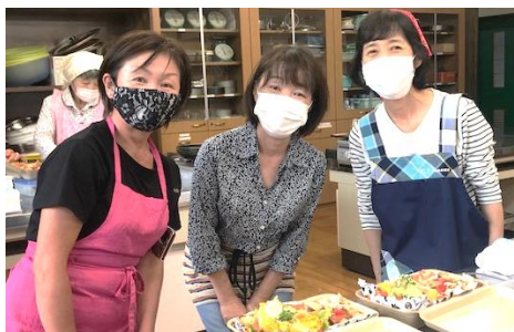
出来上がり。ハイ、ポーズ！

調理室の中はゆったりと和やかな雰囲気、牡蠣の香ばしい香りが漂います。見るとテーブルにはたっぷりバターとパン粉で焼いた牡蠣のグラタン。インスタ映えするボリュームサンドイッチは、野菜の上にミニオムレツが乗っています。ヨーグルトカレーソースがアクセントの豪華な一品になりました。イタリアンパセリや生ハムを使ったマリネはプロバンス風。行ったこともないのに気分はイタリアンです。今年度最後のロハスも優雅で楽しい時間となりました。