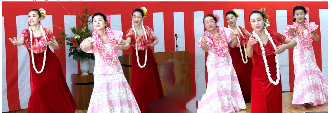
「月の夜は」など4曲ご披露頂いた、フラ・ルアカハのみなさん