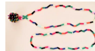
松ぼっくりのペンダント