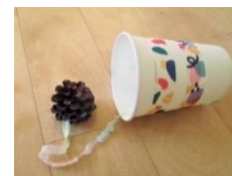
松ぼっくりのけん玉